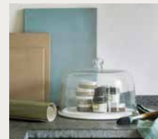
Kalkverf Arenaria ( cartecolori.nl ), Classico krijtverf Blue Reef ( pure-original.nl ),