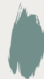
Blue Reef

Met beige tinten kun je mooie nuances maken. Samen met een verzadigd groen is het een warme en rustige basis.