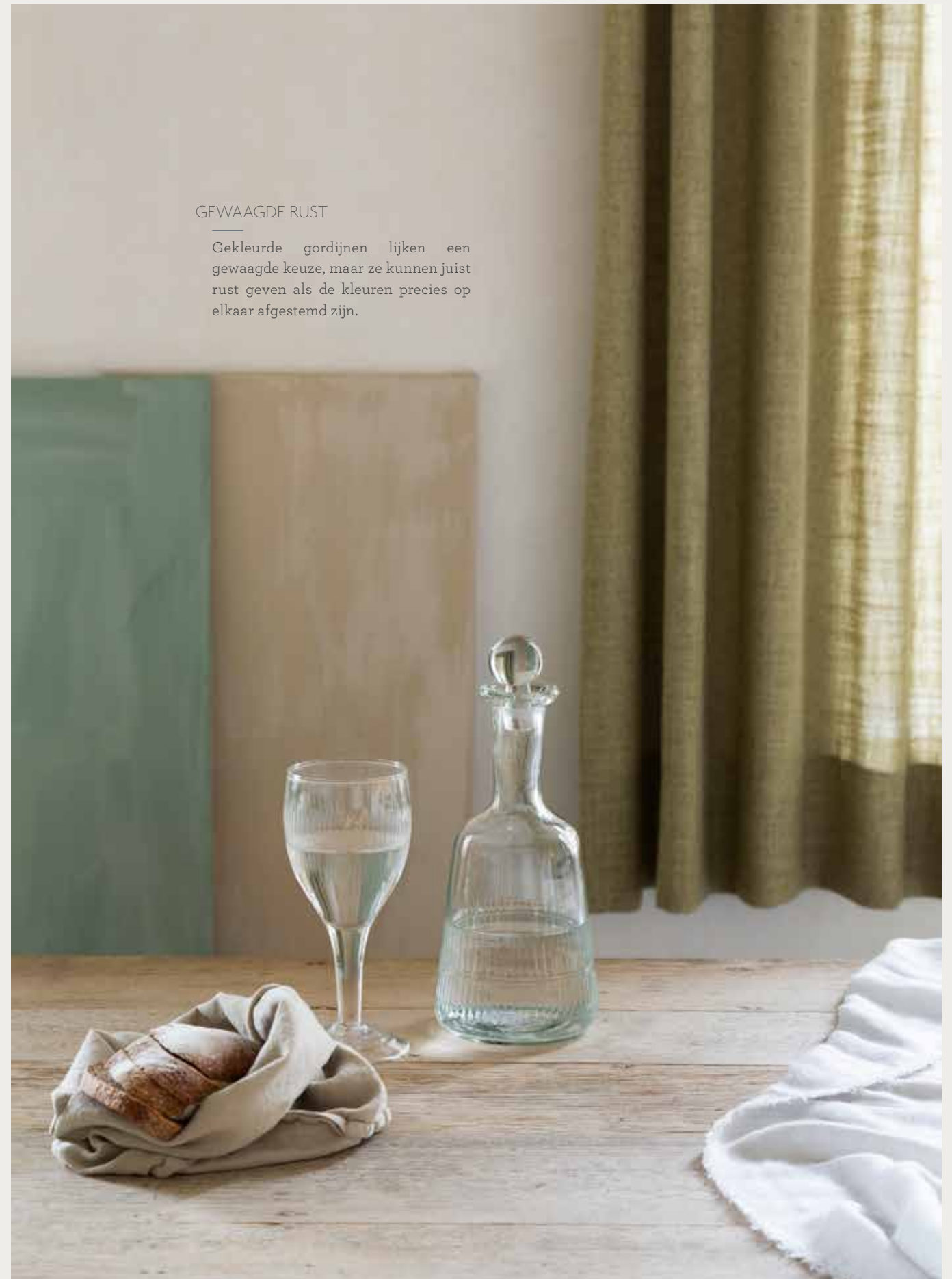
Alle gordijnen in de vakantiewoning zijn gemaakt door Duchi Decor.

Gekleurde gordijnen lijken een gewaagde keuze, maar ze kunnen juist rust geven als de kleuren precies op elkaar afgestemd zijn.