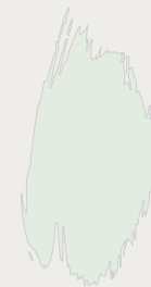
Pearl Colour Pale

“We waren toevallig te weten gekomen dat deze hoeve te koop stond”