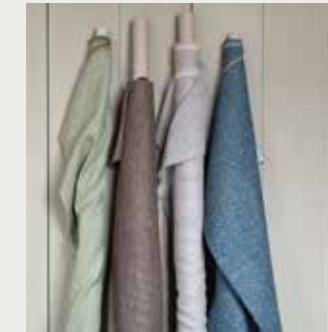
Skye Peridot FDG2701/27 van Designers Guild, Vezzano Marine FDG2702/18 van Designers Guild ( beide wva.nl of alinee.be ), bruine in textuur geweven linnen voor gordijnen, Arima YP20003 uit de Fuego-collectie, zacht beige in textuur geweven linnen voor gordijnen Arima YP20002 uit de Fuego-collectie ( beide designsofthetime.be )