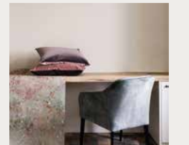
2 kussens Cassia Cameo CCDG0947 van Designers Guild, behangpapier PDG1118/01 shino copper van Designers Guild ( beide wva.nl of alinee.be )