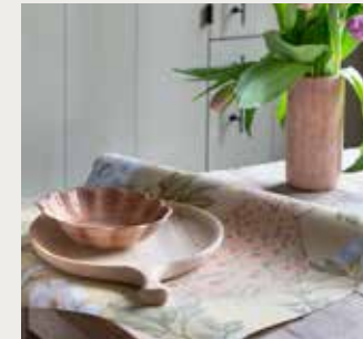
Jug Sam Baron 70 cl van Mateus in kleur cinnamon (49,50 euro, zwaanzinnig.shop ), behang Pavona Gina ( littlegreene.eu ), serveerplank Natural Large (46,40 euro, Nkuku via prospectt.nl ), Oyster bowl medium 24 cm van Mateus in kleur cinnamon (45,50 euro, zwaanzinnig.shop )

Combineer verschillende soorten handdoeken. Hier is gevarieerd met één kleur om het pure kloostergevoel van de ruimte tot zijn recht te laten komen.