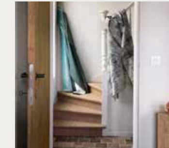
Blauwe velvet stof Opera aqua FDG2700/32 van Designers Guild, donkerblauwe stof met grove structuur Vezzano Marine FDG2702/18 van Designers Guild ( beide wva.nl of alinee.be ), stonewashed stof voor accessoires en gordijnen, linnen, wol en Jacquard, Chunga YP20008 uit de Fuego-collectie ( designsofthetime.be )