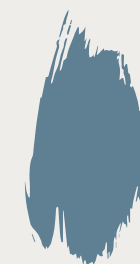
Denim CC12