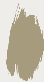
Portland Stone Dark 157

Vlakken en geometrie zijn interessant voor elk interieur. Geometrische prints kunnen ook subtiel en tijdloos zijn.