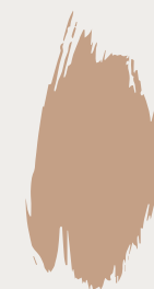
Castello CC015