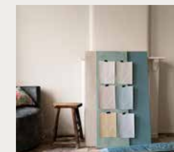
Grote panelen kalkverf Serena en Lagune ( cartecolori.nl ), groot paneel rechts met Classico krijtverf Blue Reef, krijtverf Classico Polar Blue, krijtverf Classico Silver clay ( alles pure-original.nl ), verf Joanna 130, verf Portland Stone 77, verf mushroom 142, verf Bath stone 64 ( alles littlegreene.eu ), blauwe velvet stof