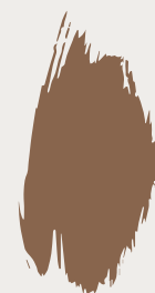
Elefante CC017

De gordijnen zijn afgestemd op de vloer en geven een pittige nuance aan het beige palet.